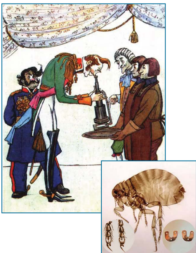
Иллюстрация к повести Н.С. Лескова «Сказ о тульском косом Левше и о стальной блохе» (художники Кукрыникисы, 1974 г.)

«Сказ о тульском косом Левше и о стальной блохе»